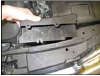
Fig. # 17