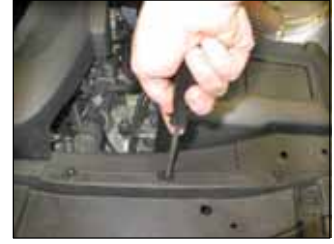
Fig. # 16