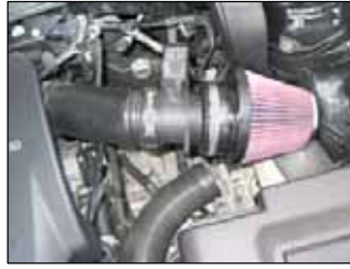
Fig. # 19